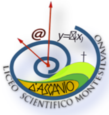
Liceo Scientifico "C. D'Ascanio" Via Polacchi s.n.c. 65015 Montesilvano (Pe)