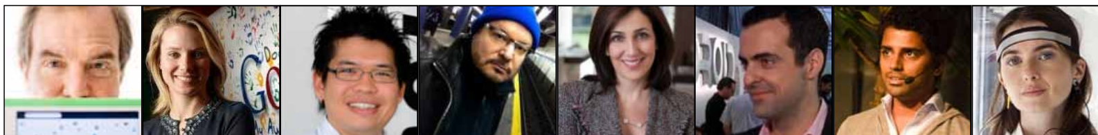
Nicholas Negroponte One Laptop per Child MIT Boston

Molti attori protagonisti dell'innovazione in Italia e in Europa e alcuni ospiti internazionali di grande interesse.